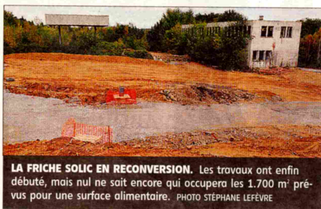
LA FRICHE SOLIC EN RECONVERSION. Les travaux ont enfin débuté, mais nul ne sait encore qui occupera les 1.700 m 2 prévus pour une surface alimentaire.

Le plus. Le futur Ehpad (Établissement d'hébergement pour personnes âgées dépendantes) devrait être un vrai soulagement pour la commune, d'autant qu'il n'aura pas d'impact budgétaire. Cofinancé par l'État et le département de la Haute-Vienne, il remplacera l'actuelle maison de retraite, dont les locaux sont vétustes. Il s'agit du seul projet de ce type en Haute-Vien-